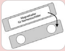
Magnethalter 4,80 € Aufpreis!