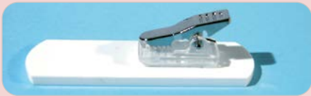
Klammer oder Anstecknadel ohne Aufpreis!